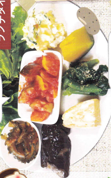
おすすめメニュー例