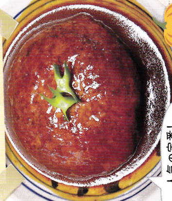
人気の定番！ 煮込みハンバーグ

〔メイン＋野菜プレート＋ ごはん又はパン＋スープ〕 メインは、定番の「煮込みハン バーグ」の他に、「週替わりで 「おすすめメニュー」をご用意し ています！