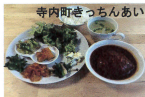
寺内町きっちんあい