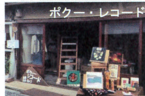
ポカー・レコード