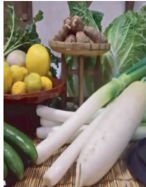
※季節によって使用する野菜は変わります。