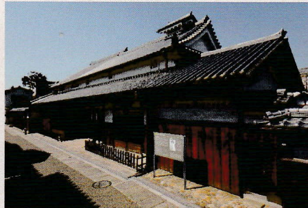
歌人 石上露子の生家