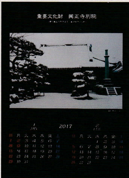
雪の興正寺別院本堂