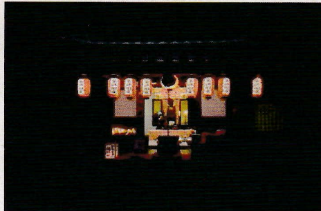
半偈山浄谷寺護持