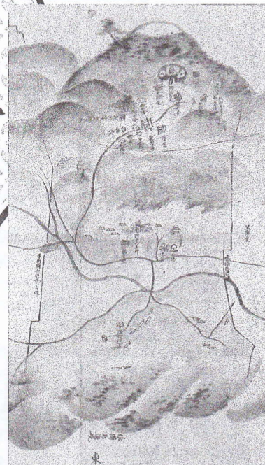
龍泉村絵図 (部分) (江戸時代)