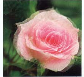
②二重にだぶって見える