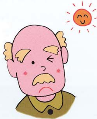
③明るいとまぶしくて見えにくい