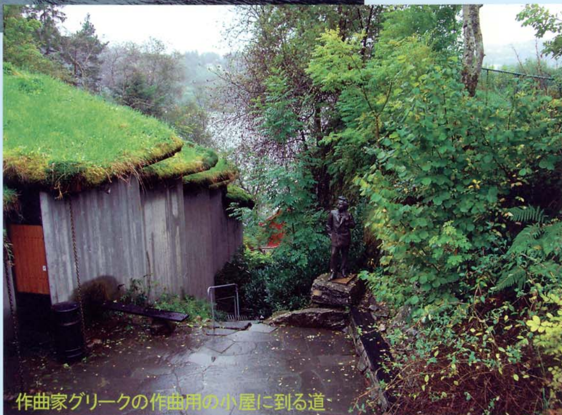
作曲家グリークの作曲用の小屋に到る道