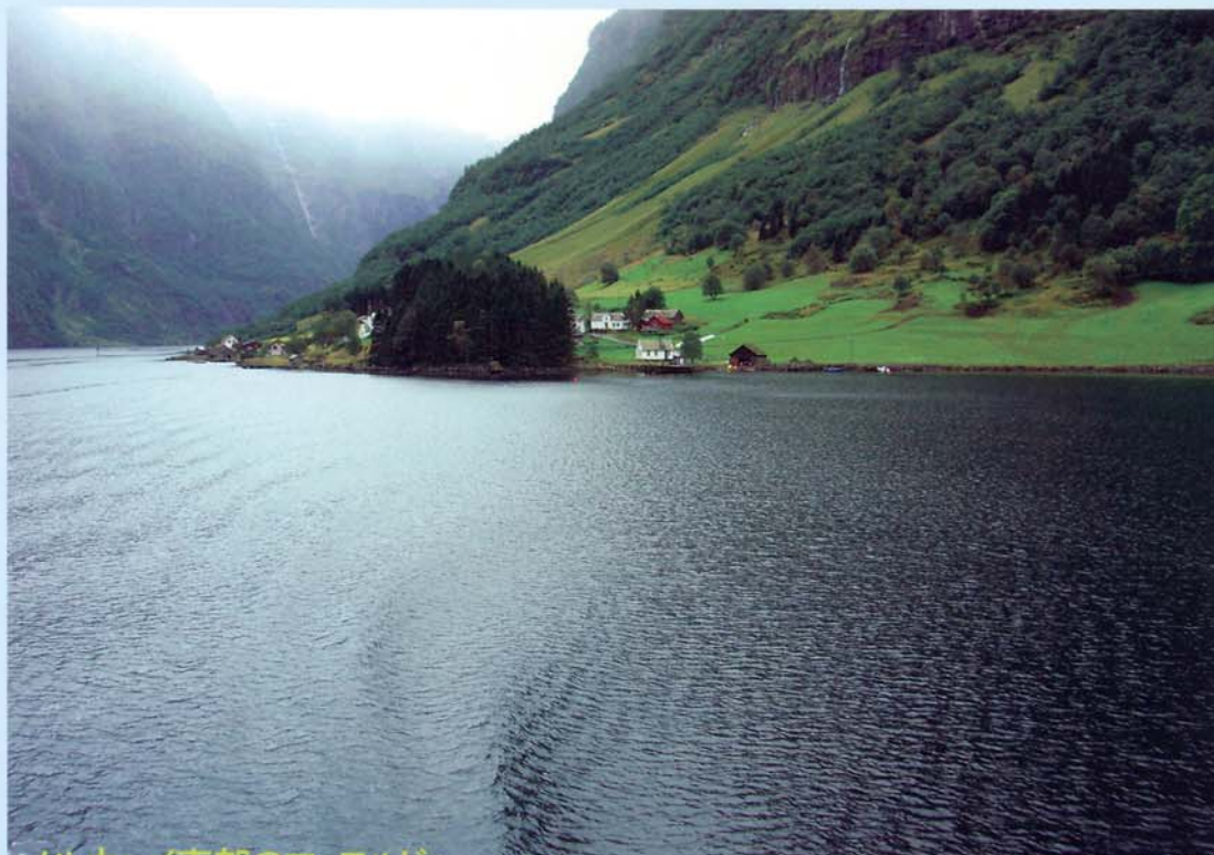
ノルウェイ東部のフィヨルド

URL http://www.5d.biglobe.ne.jp/~tanieye/