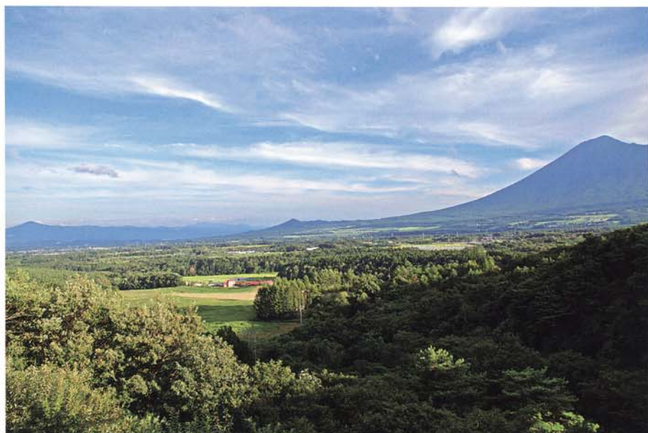
あせぬま橋から 裏岩手・姫神山・ 早池峰山を望む