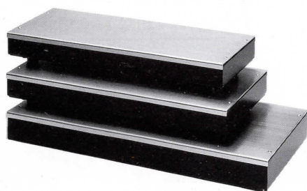
SL-7HG SL-9HG SL-15HG

シングルステレオパワーアンプ、プッシュプルステレオパワーアンプ、Trパワーアンプ、キーボード他、上面操作の多い機器に最適。