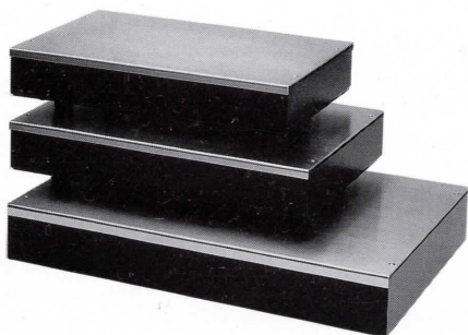
SL-8HG SL-10HG SL-20HG