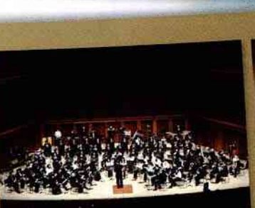
阪急百貨店吹奏楽団