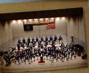
ブリヂストン吹奏楽団久留米