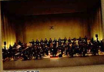
東芝府中吹奏楽団