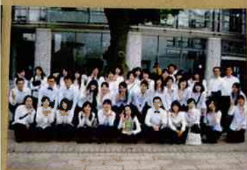
六花亭管楽器アンサンブル