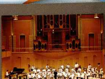
トヨタ自動車(株)吹奏楽団