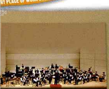
パナソニック電工吹奏楽団