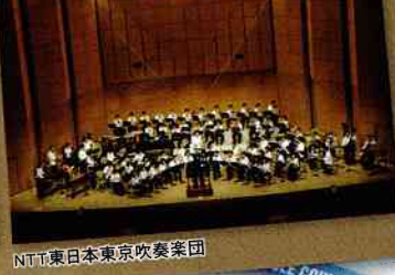
NTT東日本東京吹奏楽団