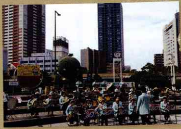
はましんウインドオーケストラ