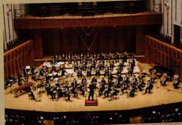
NTT東日本東京吹奏楽団