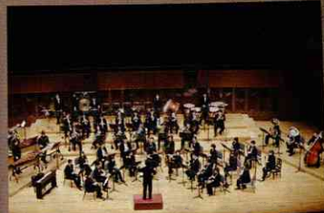
バナソニックES吹奏楽団