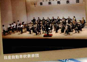
日産自動車吹奏楽団