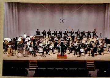
東芝府中吹奏楽団