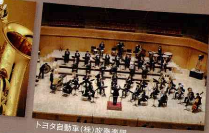
トヨタ自動車(株)吹奏楽団