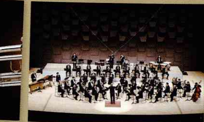
阪急百貨店吹奏楽団