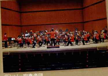
デンソー吹奏楽団