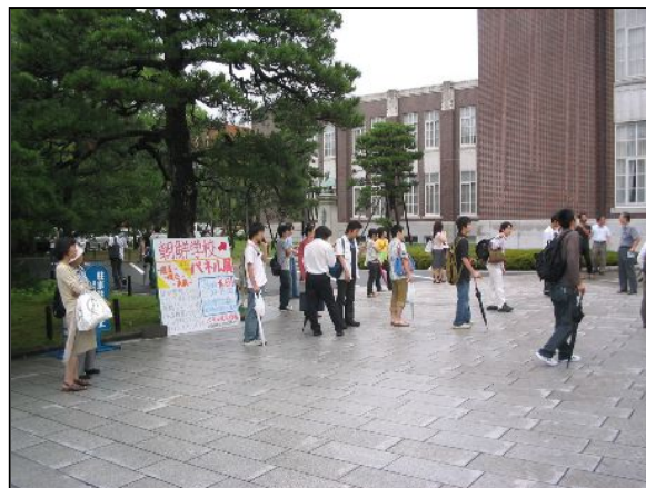
スティグリッツ氏の講演会場に入りきれなかった人々。その後ろにあるのは、パネル展案内の看板。みなさん、せっかくですから、パネル展に来てください。