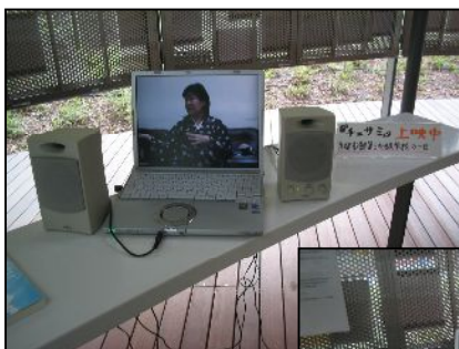
校長先生と、オモニ、お二人のお話をみんな真剣に見ていました。