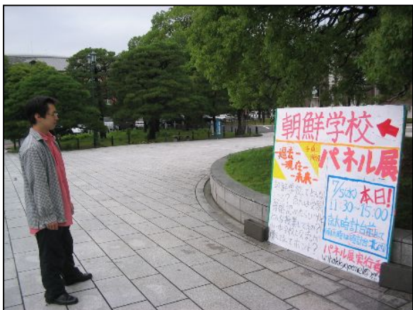
看板を熱心に見入る人。スタッフです。