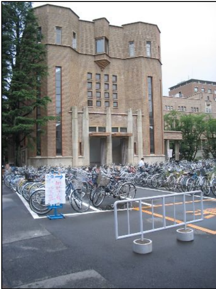
この建物の右側面の通路で開催しました。