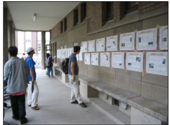
たくさんのパネル。じっくりと1時間かけて見ていってくれる人。写真や、気になるところだけ見ていく人。それぞれです。