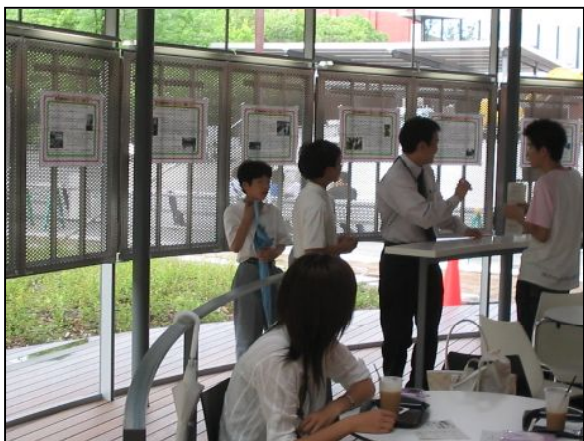
来場者にまずアンケート用紙を渡します。