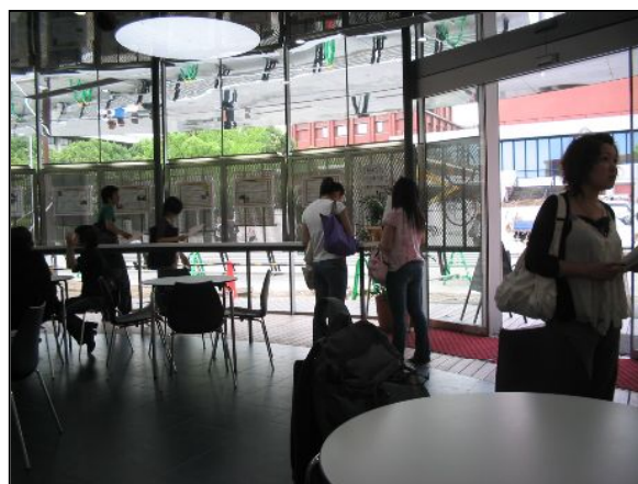
京都新聞社の取材も受け、1日目無事終了!