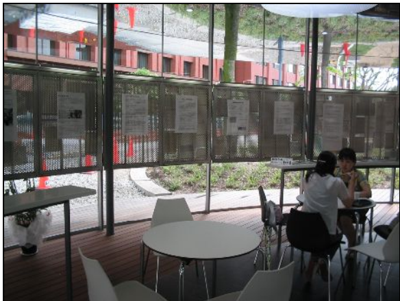
『樹林』の中はとても自然な雰囲気です。