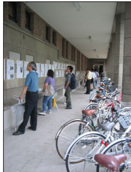
朝鮮学校の歴史については、初めて知ったという声が多く、熱心に話を聞いてくれる人もいました。