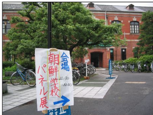
会場がわかりにくいので、矢印で誘導。