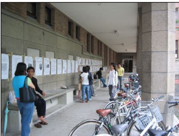
座って一服している人。通りがかりついでに目をやる人、スタッフが、通路の両脇でビラを配り展示会の案内をしています。