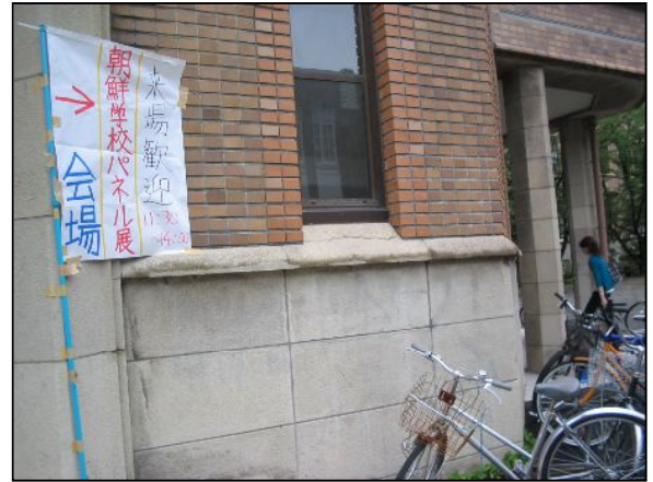
場所が通りに面していなかったため、少しわかりにくいところでしたが、遠いところ他大学からも見学に来てくれました。