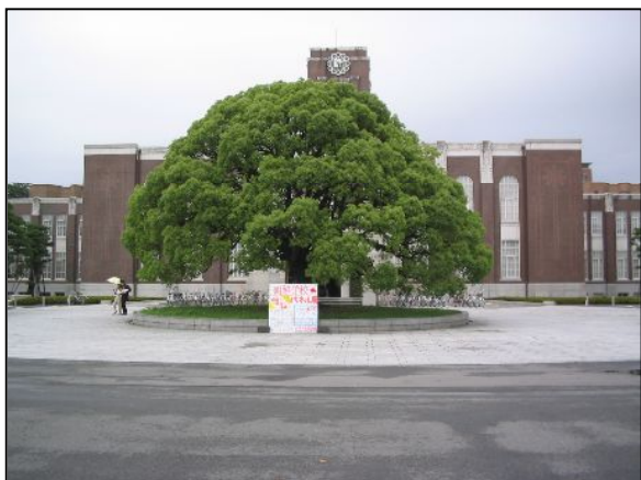
時計台クスノキ前に看板を出しました。小さいながらも、だいぶ目立っていました。