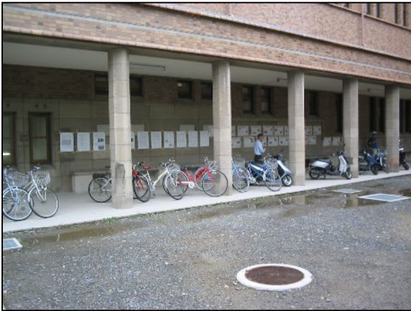
この壁沿いにパネルを展示しました。開かれた場所での展示が好評でした。