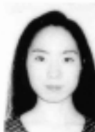
コーラス・ピアチェーレ/Chor.

東京芸術大学卒業。彩の国新進音楽家オーディション合格、デビューコンサート出演。現在文化庁派遣外研修員としてウィーン国立音楽大学に在学中。