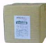
専用添加液 1Lボトル×4本入りまたは 10Lコンテナ